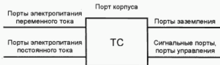
Рисунок 1 — Примеры портов ТС