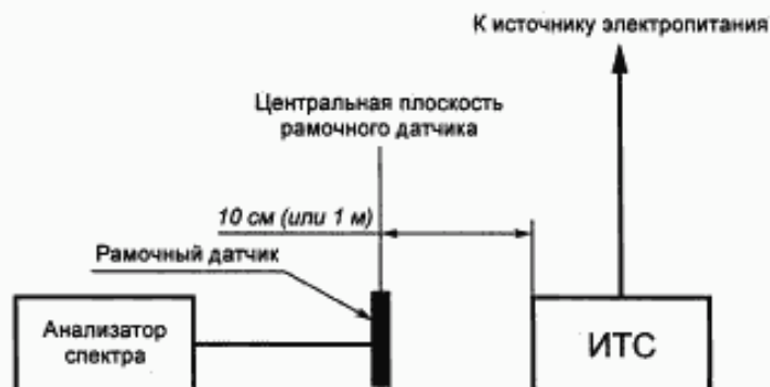
Рисунок А.2 — Испытательная установка для измерения магнитного поля, создаваемого ТС

Установка для проведения испытаний приведена на рисунке А.2.