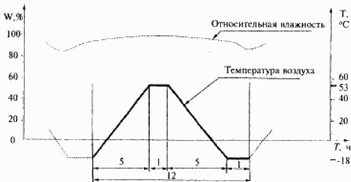
Рисунок А.2 — График одного цикла испытаний (первая часть испытаний по режиму IV)