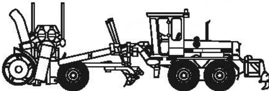
Рисунок А.3 — Автогрейдер с центробежным снегоочистителем